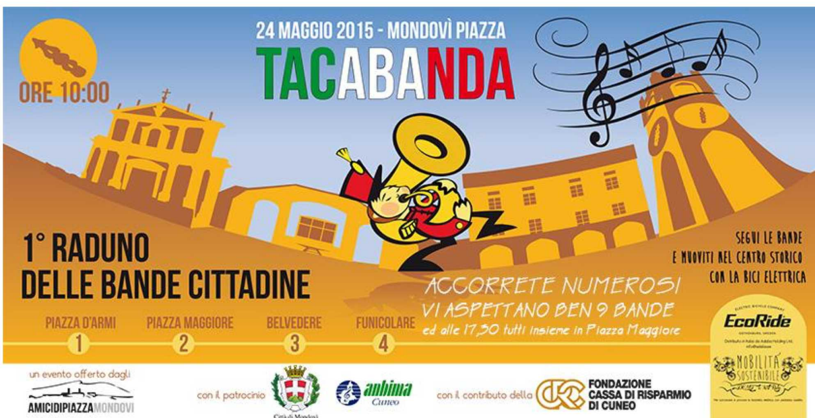
Immagine del manifesto dell'evento 2015